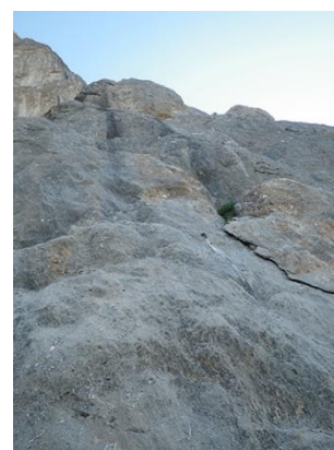
Pie de vía de la variante fácil

donde seguirá habiendo un camino marcado con hitos. Iremos hacia el punto más bajo del espolón donde veremos una fisura con una ristra de parabolts. Se trata la variante de 6b para empezar la vía. A su izquierda, junto a una laja veremos un seguro; estaremos ante el inicio fácil de la vía. A pie de este inicio de vía hay una flecha rosa, pero se ve bastante poco.