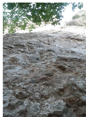
Pie de vía

Dejamos el coche en el aparcamiento de Can Maçana. Desde ahí salimos dirección este, pasando de largo del merendero, para ir a parar a una pista donde seguiremos las indicaciones de Monestir de Montserrat. Unos 10 minutos más tarde del desvío que lleva al Refugio de Vicenç Barbé, pero siguiendo por la misma pista en la que íbamos, deberíamos tener el sendero que nos interesa para llegar a pie de pared. Hay un árbol con marcas blanca y roja (como otros muchos árboles) y una pequeña piedra triangular. No acaba de ser demasiado representativo, pero si avanzamos un poco por la pista, deberíamos poder ver la pared y el techo característicos. Si llegamos a la Foradada/Cadireta, es que nos hemos pasado de largo. Ascendemos por el sendero que nos lleva a una canal, en un momento nos salimos de ésta a la izquierda, para más arriba volvernos a unir. En la canal, tendremos un tramo de cuerdas fijas que nos ayudarán a ascender. Cuando se acabe, ya veremos el techo característico y tendremos que ir hacia la derecha a buscar el pie de vía. Veremos una ristra de parabolts del Ae con el primero bastante alto, a unos 5 metros.