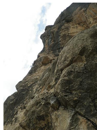
Pie de vía

vehículo. Desde ahí seguimos andando por la carretera en la misma dirección en la que veníamos conduciendo y en menos de 500 metros estaremos en el punto donde la pared toca la carretera. Subiendo 5 metros junto a la pared estaremos a pie de vía. Caminando por la carretera ya deberíamos de ser capaces de identificar la vía. A pie de vía tendremos el espárrago de un parabolt y podemos ver el primer seguro.